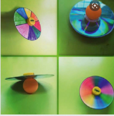
Geriye Dönüşüm (Topaç Yapımı)