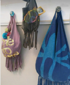
Geriye Dönüşüm (T-Shirt Yapımı)