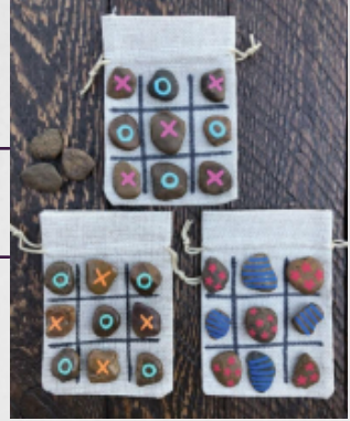
Geriye Dönüşüm (Çiz-biz Yapımı)