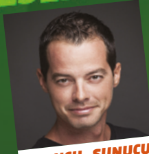
OYUNCU - SUNUCU ALP KIRŞAN