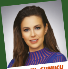
OYUNCU - SUNUCU ESRA GEZGİNCİ