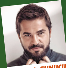
OYUNCU - SUNUCU ENGİN ALTAN DÜZYATAN