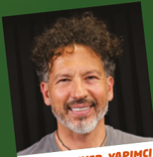
MACERASEVER - YAPIMCI ORKUN OLGAR